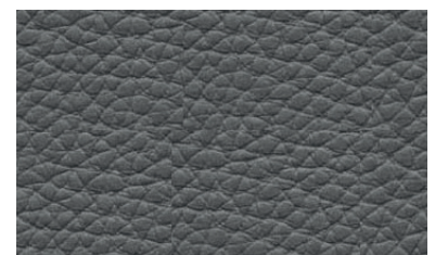
antracyt/ Anthrazit/ anthracite