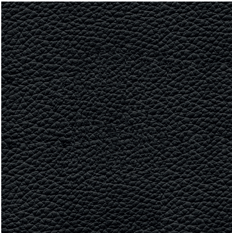
czarny/ schwarz/ black